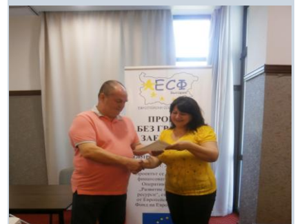
Връчване на сертификати от обучението

Всички участници оцениха високо проведеното обучение и получиха сертификати.